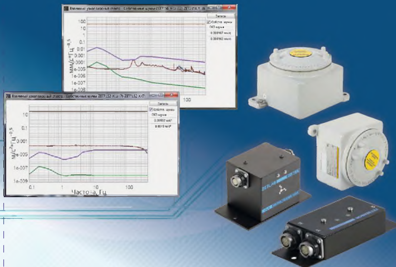
ГРАФИК СОБСТВЕННЫХ ШУМОВ

Цифровые сейсмические датчики и программное обеспечение ZETLAB SENSOR легко интегрируются с интерфейсом OPC, предоставляя пользователю мощные средства измерения и автоматизации.