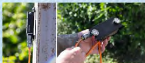
Датчик крепится с помощью магнитов

Сейсмографы являются средством измерения параметров сейсмического воздействия и могут применяться для контроля опасных участков добычи полезных ископаемых, для контроля и исследований сейсмических явлений и колебаний от взрыва, а также при проведении инженерно-геологических изысканий.